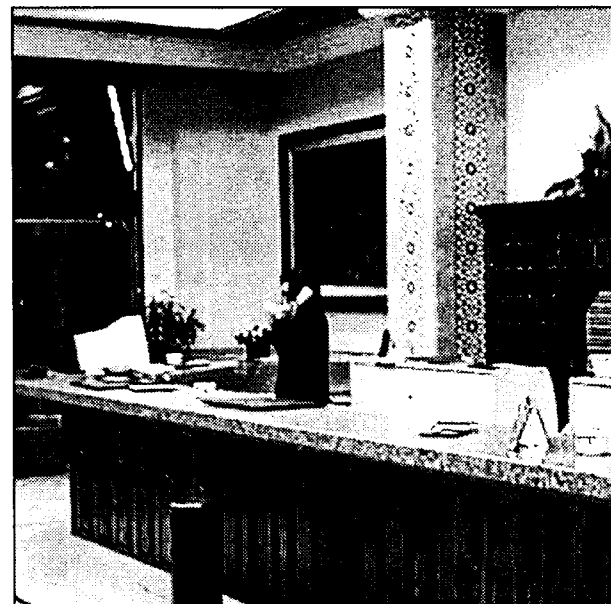
El número de hoteles se está incrementando en la región.

Pero una vez ha desaparecido el chorro, la Junta de Comunidades de Castilla-La Mancha se ha planteado la posibilidad de realizar un "hervidero artificial" en este mismo lugar y utilizarlo como un reclamo turístico. Estos posibles "proyectos económicos" deben conseguir el apoyo de iniciativas.