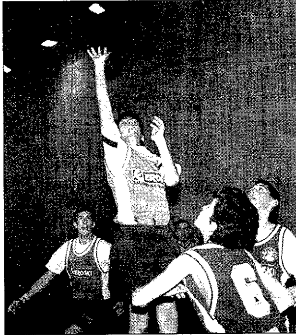
La espectacularidad también estuvo presente en el San José. A.M.P.

El Torneo, que contó con el patrocinio del Ayuntamiento de Guadalajara, la Diputación y el hipermercado Eroski, no tuvo más calificativo que el de exitoso. Precisamente, los