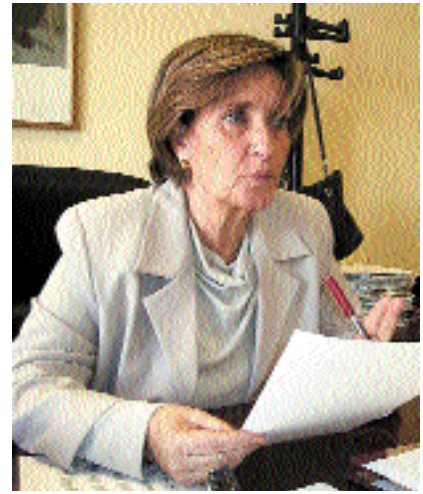
La vicerrectora de Alumnos

El Vicerrectorado de Alumnos recibe a 5.000 alumnos en los campus y estrecha sus contactos con los centros de Secundaria