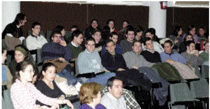
Un grupo de alumnos de La Solana, durante su visita al campus de Ciudad Real

La vicerrectora y los miembros de su equipo continuarán desarrollando estos encuentros con los directores y jefes de estudios de los centros de Enseñanza Secundaria y Bachillerato durante las próximas semanas.