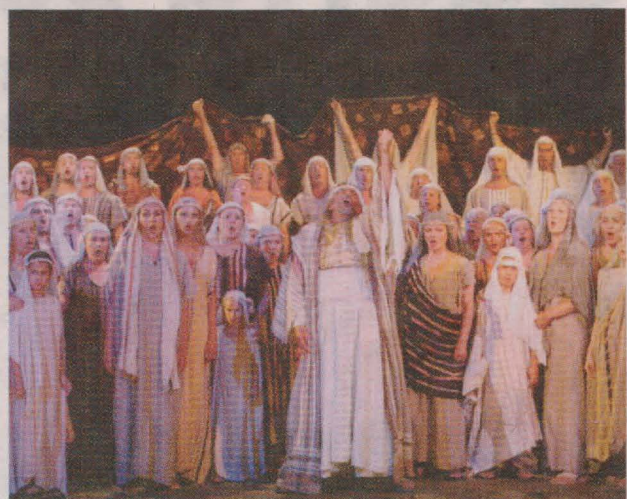
En su época, los italianos asimilaban Nabucco como un canto contra la opresión extranjera que vivían.

Homenaje a Santa Cecilia. Banda de música de Talavera, 22 de noviembre a las 20.00 horas.