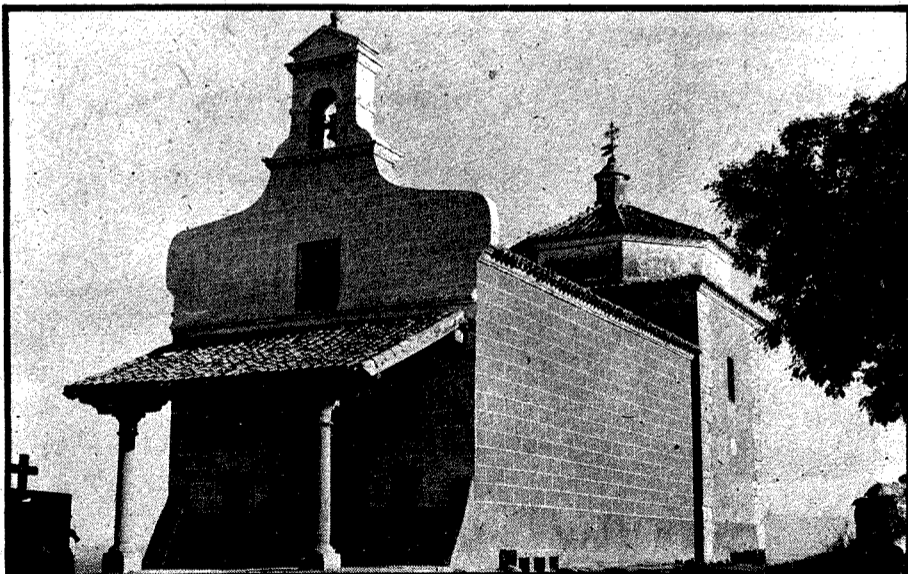
Ermita de la Virgen de los Desamparados.

Tractor STEYR 74 Cv. con trilla y accesorios, en buen uso; razón Telf. 80 04 25.