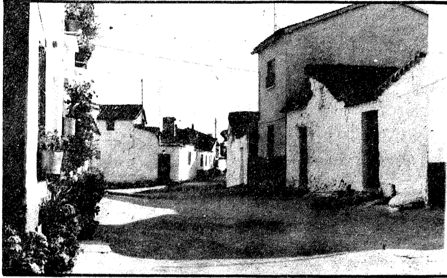
Las casas de adobe, enjalbegadas, son el tipo más común.

—Tenemos el pueblo dividido por un arroyo al cual se vierten todos los desechos de las casas y cuyo cauce está obstruido por la suciedad; esto, naturalmente, produce malos olores que se agravan puesto que las gallinas remueven la tierra. Mi ilusión sería canalizar el arroyo y plantar a los lados chopos o álamos que