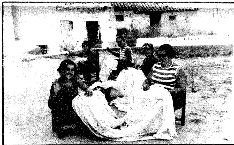
Bordados de "Lagartera" en Alcañizo.

a la par sirvieran para proteger el cauce y embellecer el pueblo.