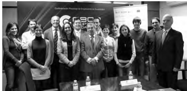
Los alumnos mostraron su satisfacción con el curso.