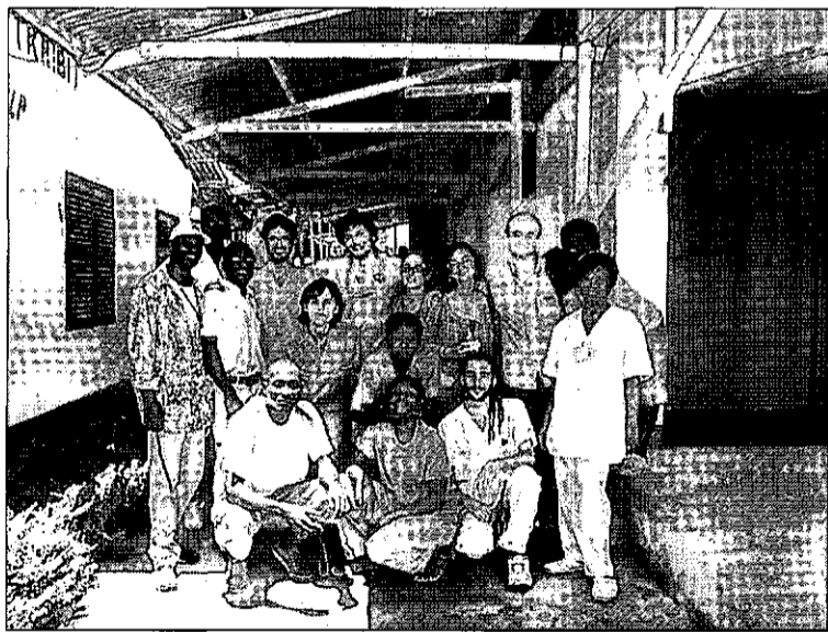
El traumatólogo de Alcázar (3d) posa en la imagen junto a otros cooperantes.

La ONG Lanzarote Help está presidida por Ricardo Cortés, un cirujano plástico español que viaja con frecuencia para operar a los más desfavorecidos, contando ya con 30 años de experiencia en África. Según el traumatólogo manchego, cualquier persona puede colaborar con esta ONG, sin tener que desplazarse allí, con pequeñas aportaciones económicas que se destinan a mejorar las condiciones del hospital y aumentar la cartera de servicios.