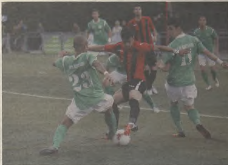
Rafita y Rony destacaron en el ataque de sus equipos.

empatar a dos en el derbi frente al Azuqueca. Era una tarde de transistores, ya que se necesitaba un pinchazo del Ciudad Real en su partido con el Villarobledo (reparto de puntos) para dejar con opciones de salvarse a los gallardos. Pero un derbi es un derbi, y en esos partidos no se regala nada. El encuentro fue del Azuqueca que pudo adelantarse en el marcador por medio de Rafita o Miguelón, pero en el primer acercamiento del Marchamalo, sería Daoiz quien adelantara a los visitantes. Todo estaba controlado para los de Quique López, hasta que a un minuto del descanso. De la Plata fue expulsado por doble amarilla. El Azuqueca, con un ju-