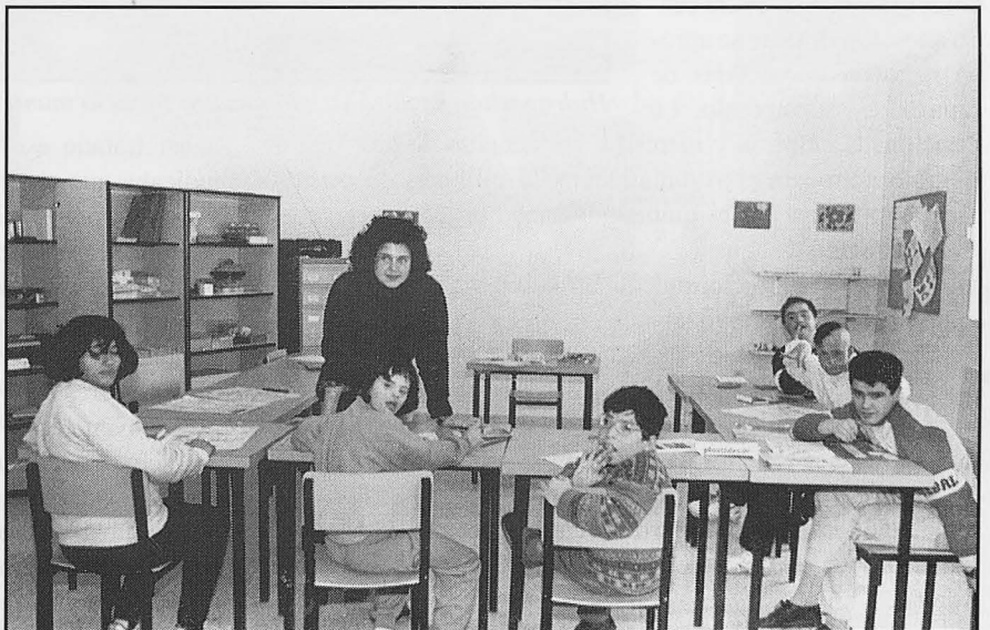
El Colegio de Minusválidos recibió 34 millones

Aunque se recurrirá ese acuerdo, tanto por el propio Juez como por el Ayuntamiento de La Solana, el pleno aprobaba por mayoría que mientras tanto ocupe el cargo el suplente elegido en su momento, indicando el portavoz del PP que su grupo estaba en contra de la elección, al haber propuesto otras fórmulas y por lo tanto ahora