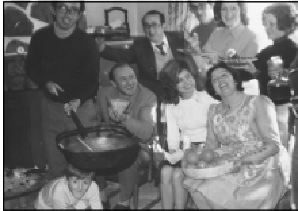
Don Luis en una reunión de matrimonios en casa de Toribio y Aurora

El Obispo de Albacete, D. Ciriaco Benavente, celebró su Misa exequial en la Catedral de Albacete a las 17 horas del viernes 11 de mayo. Descanse en paz.