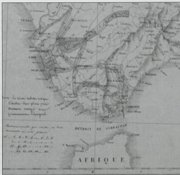
Fig. 1. Reconocimientos franceses en la Sierra de Cádiz, Ronda y Gibraltar

La división fronteriza entre los reinos castellanos y el nazarí de Granada inundó de castillos, fortalezas y torres vigías toda la zona, muchos heredados de «oppida» ibérico-romanos 1 . Las plazas fuertes, según bando y momento, servían para la protección y la