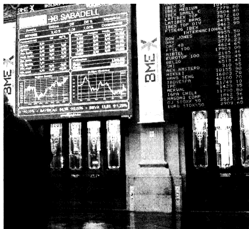
Las cotizaciones bursátiles no descansan en verano.

Las órdenes "stop loss" permiten al inversor marcar una zona (ya sea mediante gráficos o el tanto por ciento de pérdidas que está dispuesto a asumir), por debajo de la cual se venderá nuestro valor en el mercado, limitando de esta manera las pérdidas o evitando perder todo el beneficio generado en la ope-