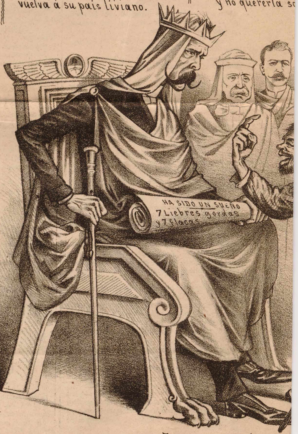
— LOS SUEÑOS DE FARAÓN —