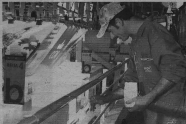
La organización ultimaba ayer los preparativos de la feria.

Un total de 665 empresas productoras y comercializadoras de todo el territorio nacional, entre ellas 164 denominaciones de origen, acudirán a la feria, que se extenderá sobre 18.283 metros cuadrados. Allí se expondrán pro-