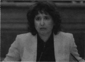
La consejera de Agricultura, Mercedes Gómez, ayer en las Cortes regionales.