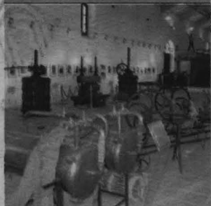
El Museo del Vino de Valdepeñas, donde se celebrará el acto.