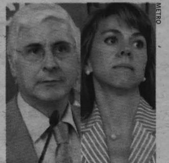
José María Barreda y María Dolores de Cospedal.

Por ello, apuntó que la presidenta del PP de Castilla-La Mancha "tendrá que hacer algún guiño a los acuerdos adoptados en Valencia, donde la política del trasvase es la de la solidaridad en el PP", concluyó el dirigente popular. EFE