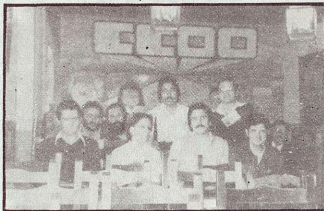
Compañeros encargados del Servicio de Orden, recuento de votos, etc...