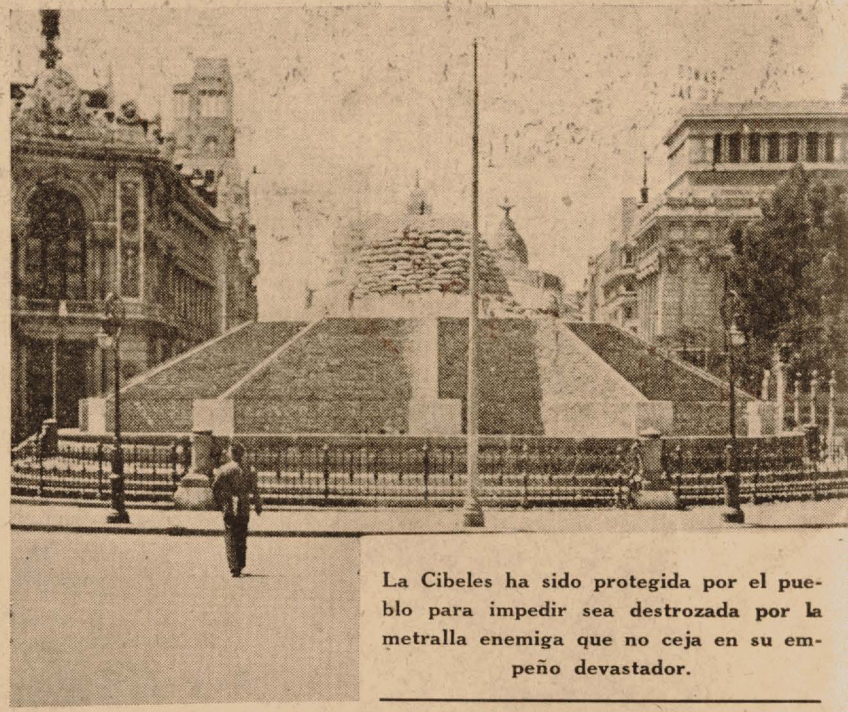
La Cibeles ha sido protegida por el pueblo para impedir sea destruida por la metralla enemiga que no cesa en su empeño devastador.