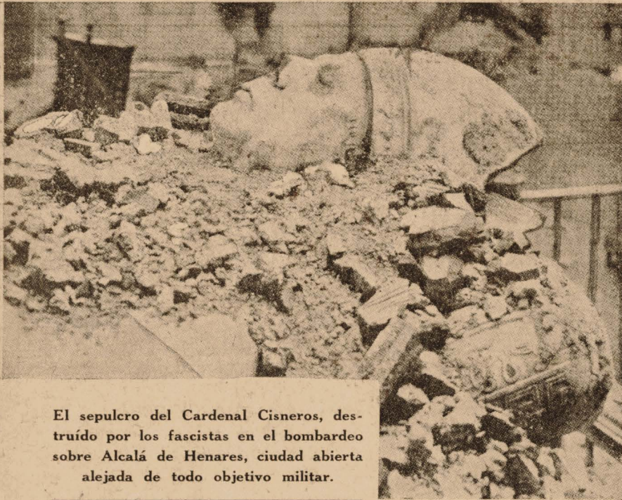
El sepulcro del Cardenal Cisneros, destruido por los fascistas en el bombardeo sobre Alcalá de Henares, ciudad abierta alejada de todo objetivo militar.