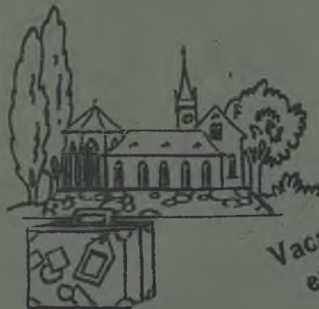
Vacaciones en un Monasterio