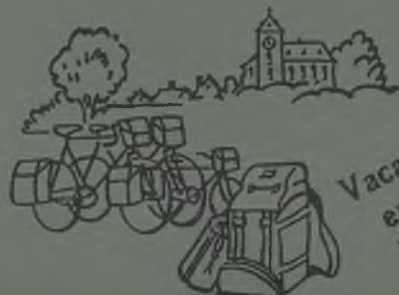
Vacaciones en contacto con la Naturaleza