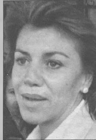
María Dolores Cospedal, presidenta regional del PP