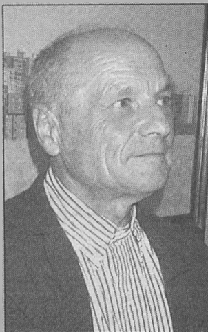
Antonio López García, pintor natural de Tomelloso.