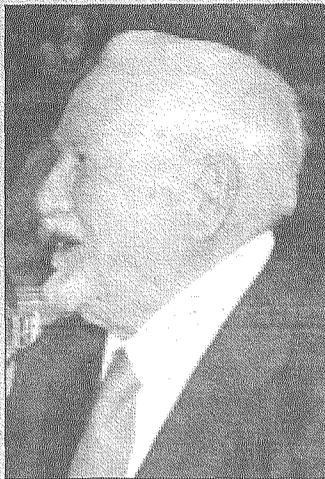
Fernando Chueca Goitia, arquitecto