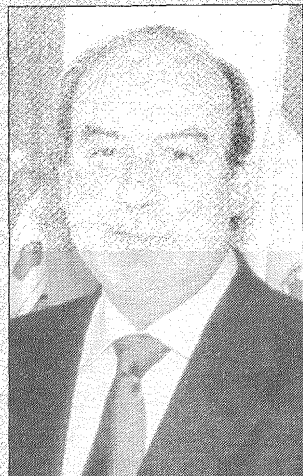
Manuel Pérez Castell, alcalde de Albacete