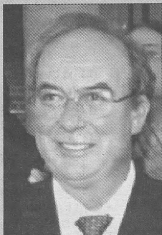
Manuel Pérez Castell, alcalde de Albacete