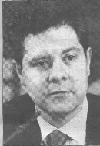
Emiliano García-Page, vicepresidente segundo

Ya se sabe, "según el cristal con que se mira".