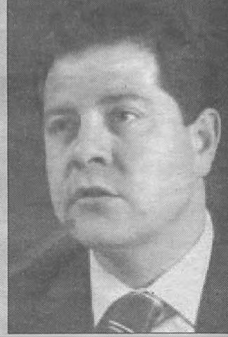
Emiliano García-Page, candidato socialista a la Alcaldía de Toledo

Aviso: vuelve Plinio, tiemblan los asesinos.