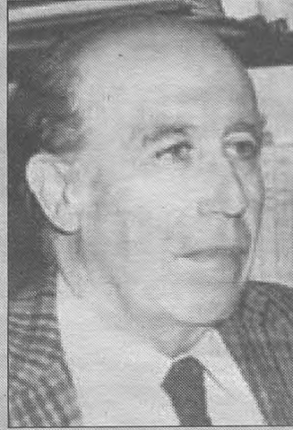
Francisco García Pavón, escritor tomellosero