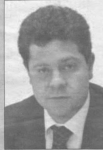
Emiliano García-Page, recupera la Alcaldía de la capital regional