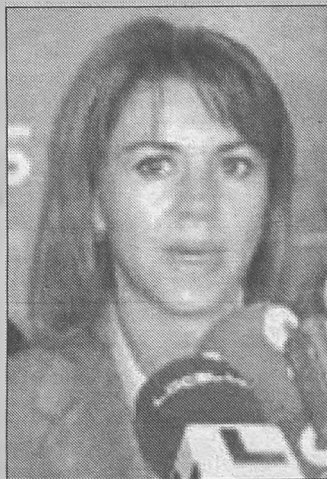
María Dolores de Cospedal, presidenta regional del PP