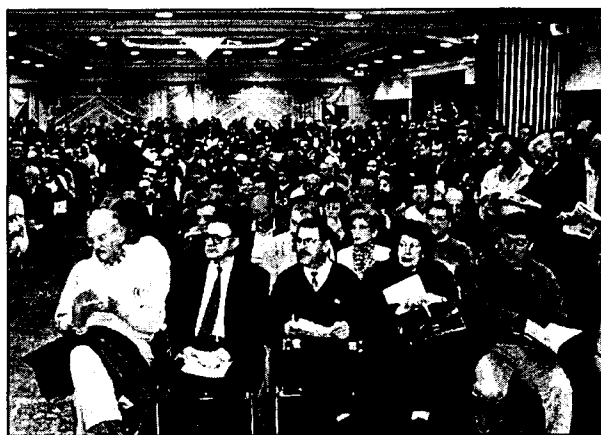
En todas las subastas ha habido gran asistencia de público.

En la segunda sesión, celebrada en Ciudad Real, y en la que se subastaban inmuebles de Ciudad Real y Albacete, se vendió el ochenta y cinco por ciento de los inmuebles sacados a subasta. Se ad-