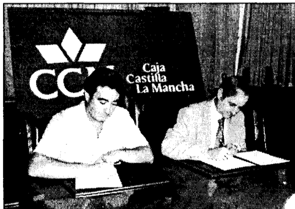
En la imagen, un momento de la firma del convenio.

El director general de CCM destacaba la importancia que pueden tener estos planes para la región ya que