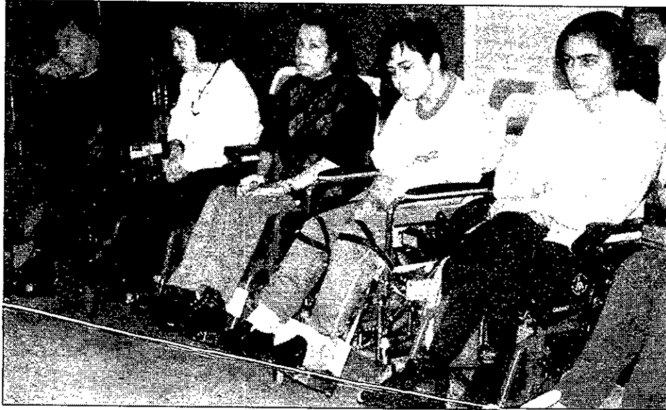
Bienestar Social ha invertido más de 162 millones de pesetas en obras y cursos para discapacitados.

La mayor partida presupuestaria se ha destinado a la construcción y obras de mejora en centros propios de la Consejería y de otras asociaciones o instituciones en los que diariamente realizan su actividad personas con algún tipo de discapacidad física, como el centro Las Encinas, el local de la asociación Apiepa o los de Famfigu