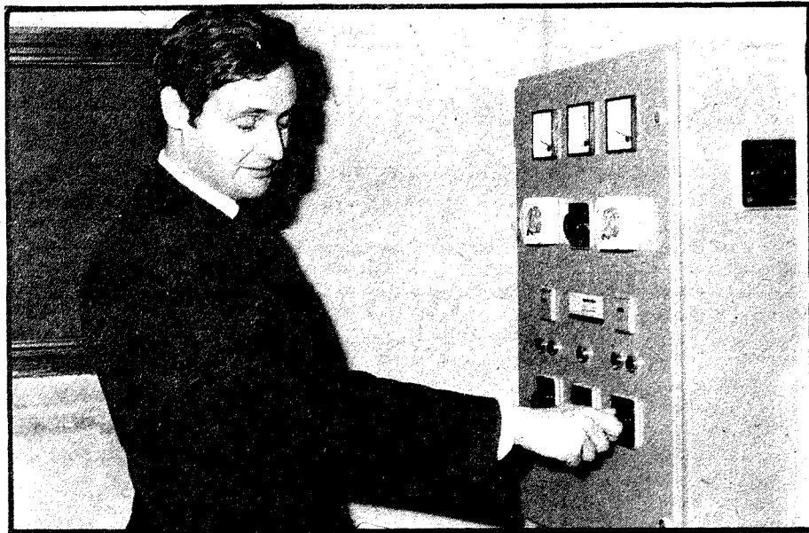
El Excmo. señor Gobernador Civil de la Provincia pulsa el botón que pone en funcionamiento el complejo de abastecimiento de agua y saneamiento de Alcaudete.