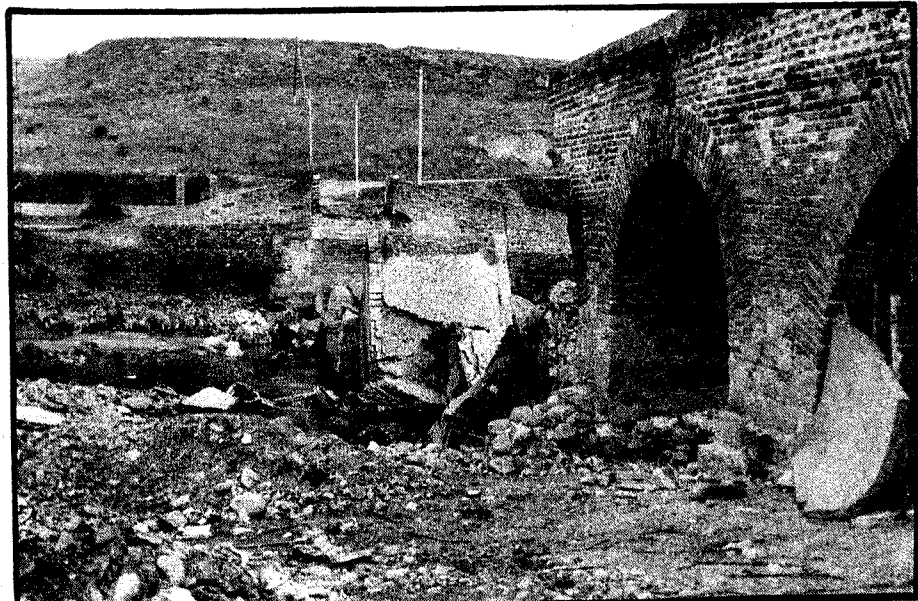
Los alcaudetanos pidieron al gobernador el arreglo del puente sobre el Gévalo.