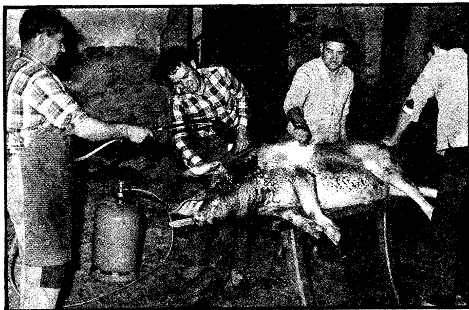
Un simpático detalle en las calles de Alcaudete. La típica matanza del cochino que como novedad aporta el "chamuscarle" con un soplete de butano en lugar de las escobeñas. (Hoy los tiempos adelantan...).