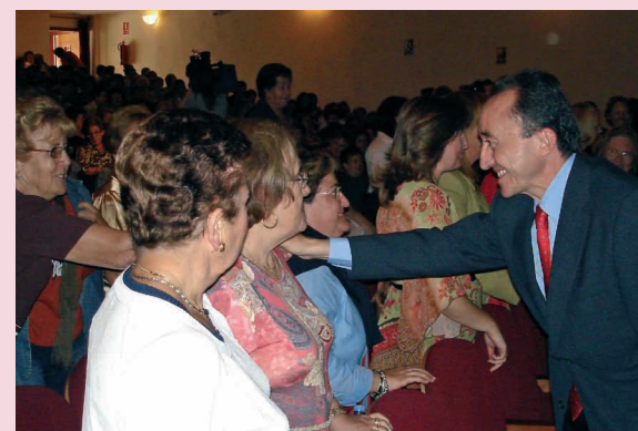
El vicepresidente primero del Gobierno regional, Fernando Lamata, acompañó a la Asociación Provincial de Amas de Casa "Calatrava" en su acto conmemorativo del Día Nacional del Ama de Casa.

Las miles de integrantes de Asociaciones de Amas y consumidores de Castilla-La Mancha celebraron un año más el Día Nacional del Ama de Casa. Una jornada en la que tuvieron lugar numerosos actos informativos y de ocio en toda la región y que sirvió nuevamente para recordar la aportación histórica y tradicionalmente siempre silenciada de las amas de casa.