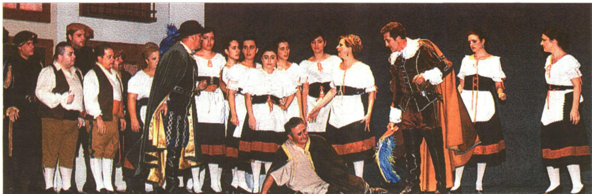
Los miembros de la compañía Maestro Andrés Uriel de la ACAZ pusieron en escena la zarzuela de 'El huésped del sevillano' con un gran éxito de público.