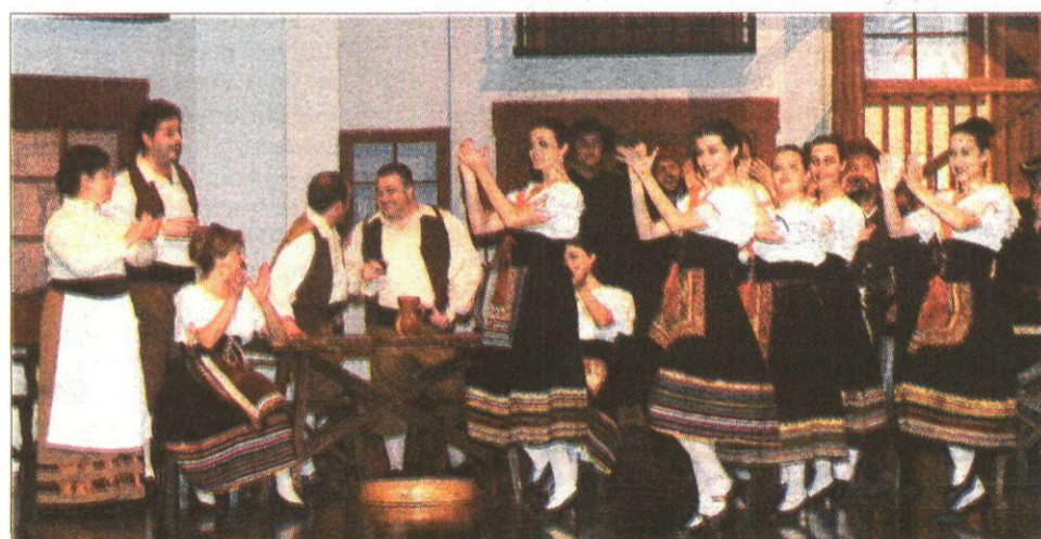
El elenco de cantantes de 'El huésped del sevillano' rayaron a gran altura.