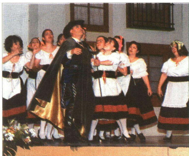
Otro de los momentos de los solaneros en 'El huésped del sevillano'.

Por su parte, la compañía profesional de Musiarte Producciones puso en escena con brillantez y de manera espectacular una Antología de la zarzuela , que agradó mucho a los espectadores. Más de 25 asociaciones de la región ya se han pasado por el teatro solanero para presenciar alguna de las funciones programadas para esta edición.