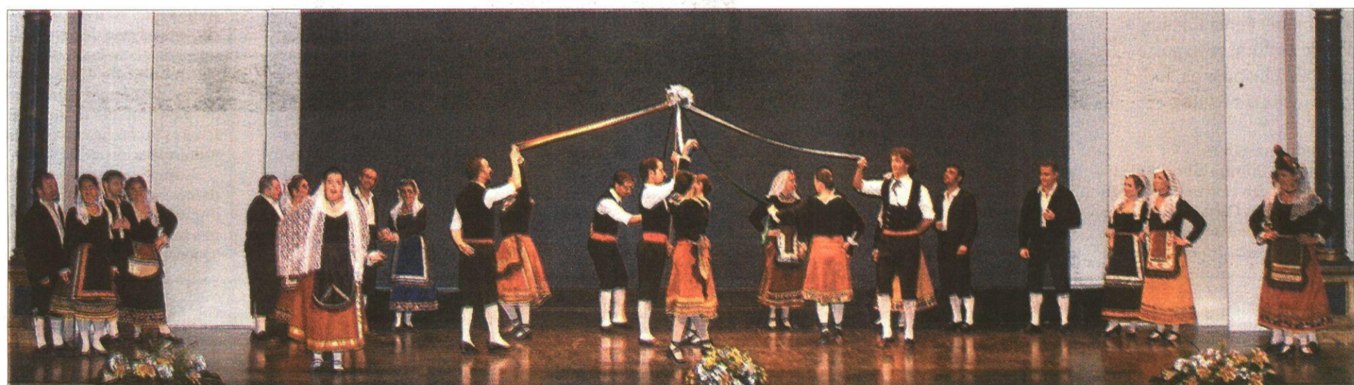
La compañía profesional Musiarte Producciones puso en escena el pasado domingo en el teatro solanero la obra 'Antología de la zarzuela'.