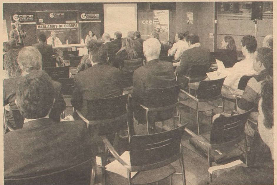
La primera de las jornadas del primer ciclo tuvo mucha expectación entre los asistentes.

La naturaleza, en su sentido más naturaleza, en su sentido más amplio, es equivalente al mundo naturalio, es equivalente al mundo natural