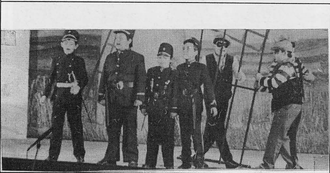
C.P. El Santo en "Los Ratás" de "La Gran Vía"