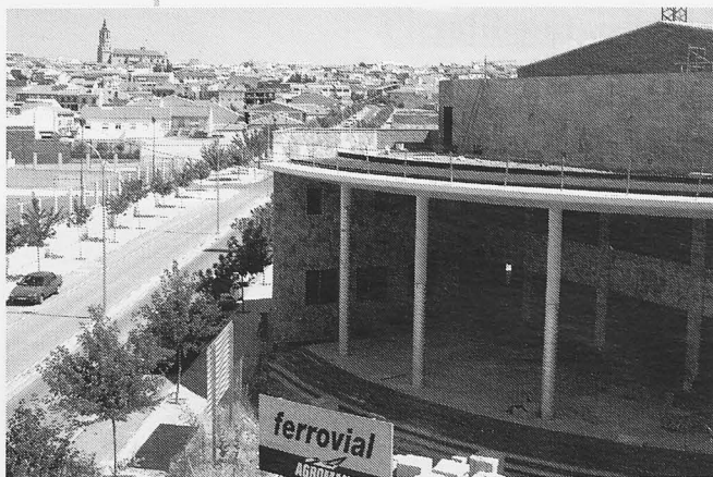
Imagen de La Solana desde el nuevo Teatro Municipal.