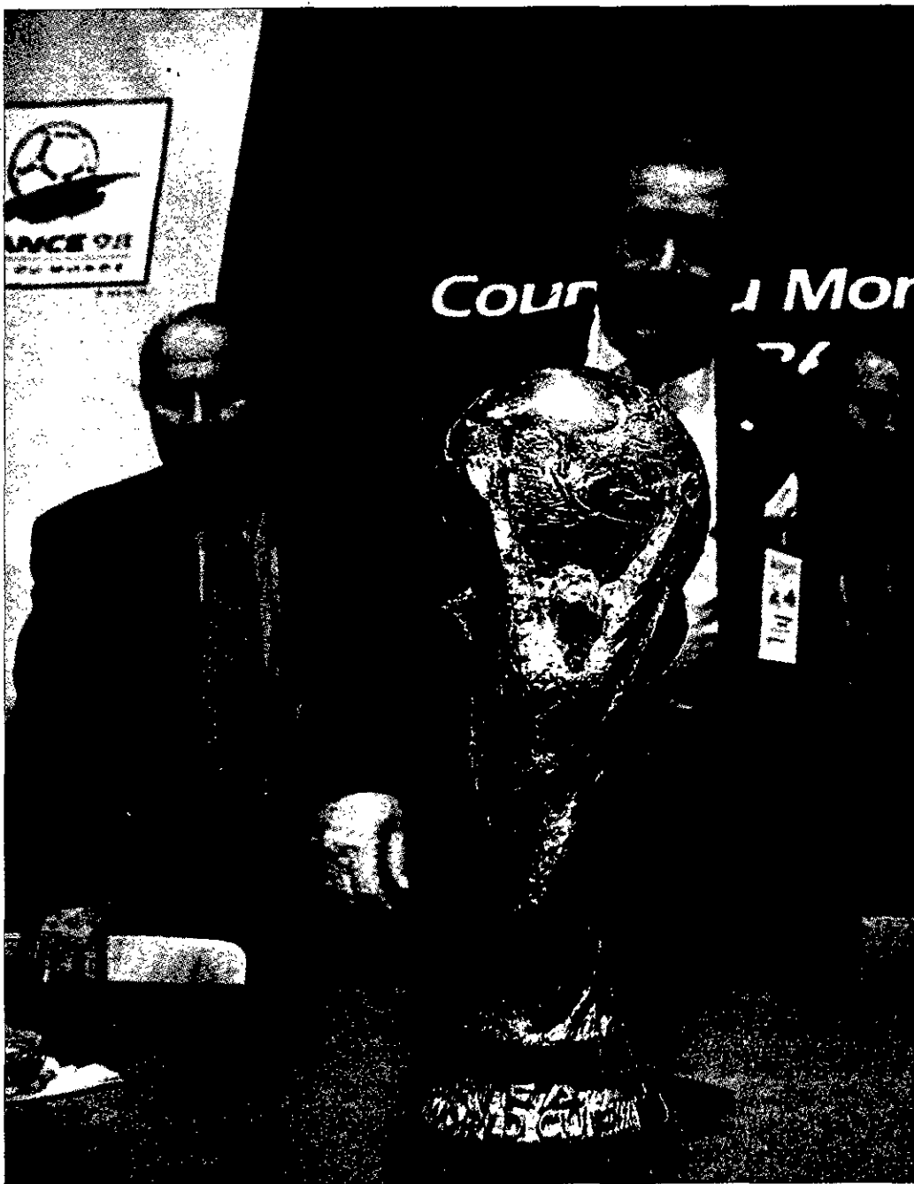
EN MARSELLA Johansson y Blatter (izquierda), durante la rueda de prensa de ayer, una vez elegidos los cabeza de serie.

El criterio de la FIFA otorgó a la selección de Clemente el 'cartel' de cabeza de serie