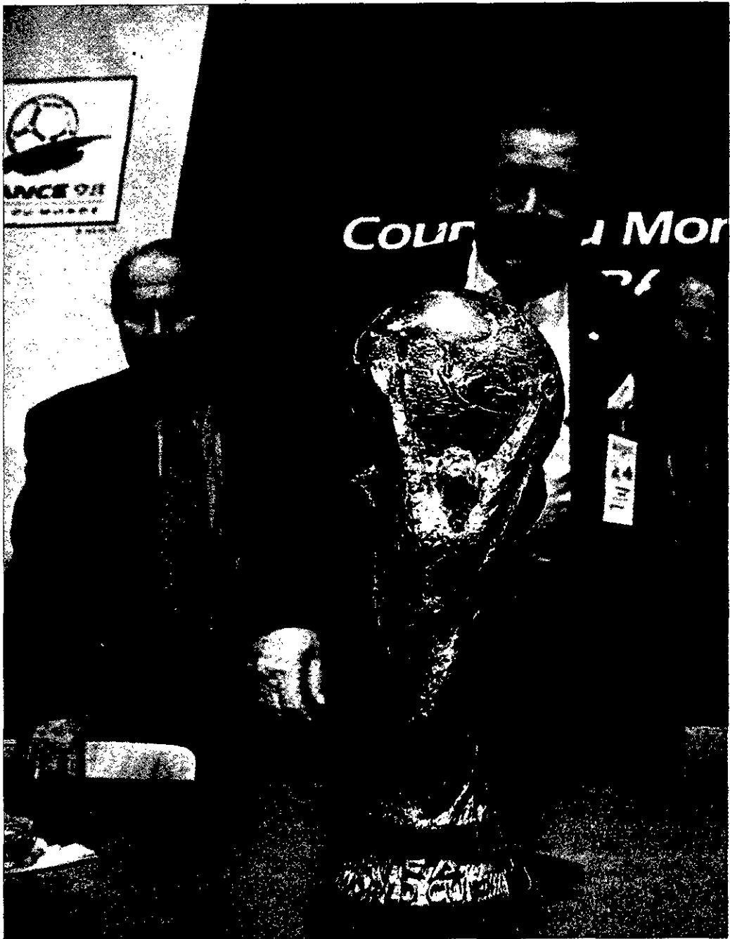
EN MARSELLA Johansson y Blatter (izquierda), durante la rueda de prensa de ayer, una vez elegidos los cabeza de serie.

El criterio de la FIFA otorgó a la selección de Clemente el 'cartel' de cabeza de serie