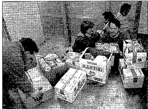
El camión fue cargado el sábado por la mañana.

accidente traumático y, de ellos, el 65% por accidente de tráfico. La edad media de los ingresados ha disminuido en el último quinquenio de 38 a 33 años con traumatismos totales. La tasa mayor de incidencia la tiene Toledo (20,6), seguida de Cuenca (13,1), Albacete (12,7), Guadalajara (10,4) y Ciudad Real (9,9).