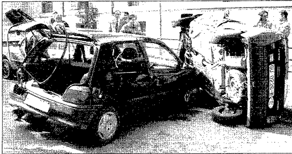
Guadalajara tiene una tasa de incidencia en lesión medular de 10,4 respecto al resto de la provincia.

El 56% de las víctimas de accidentes de tráfico que tuvieron como consecuencia una lesión medular no usaban cinturón de seguridad, el 26% no llevaba reposacabezas en el automóvil y el 16%