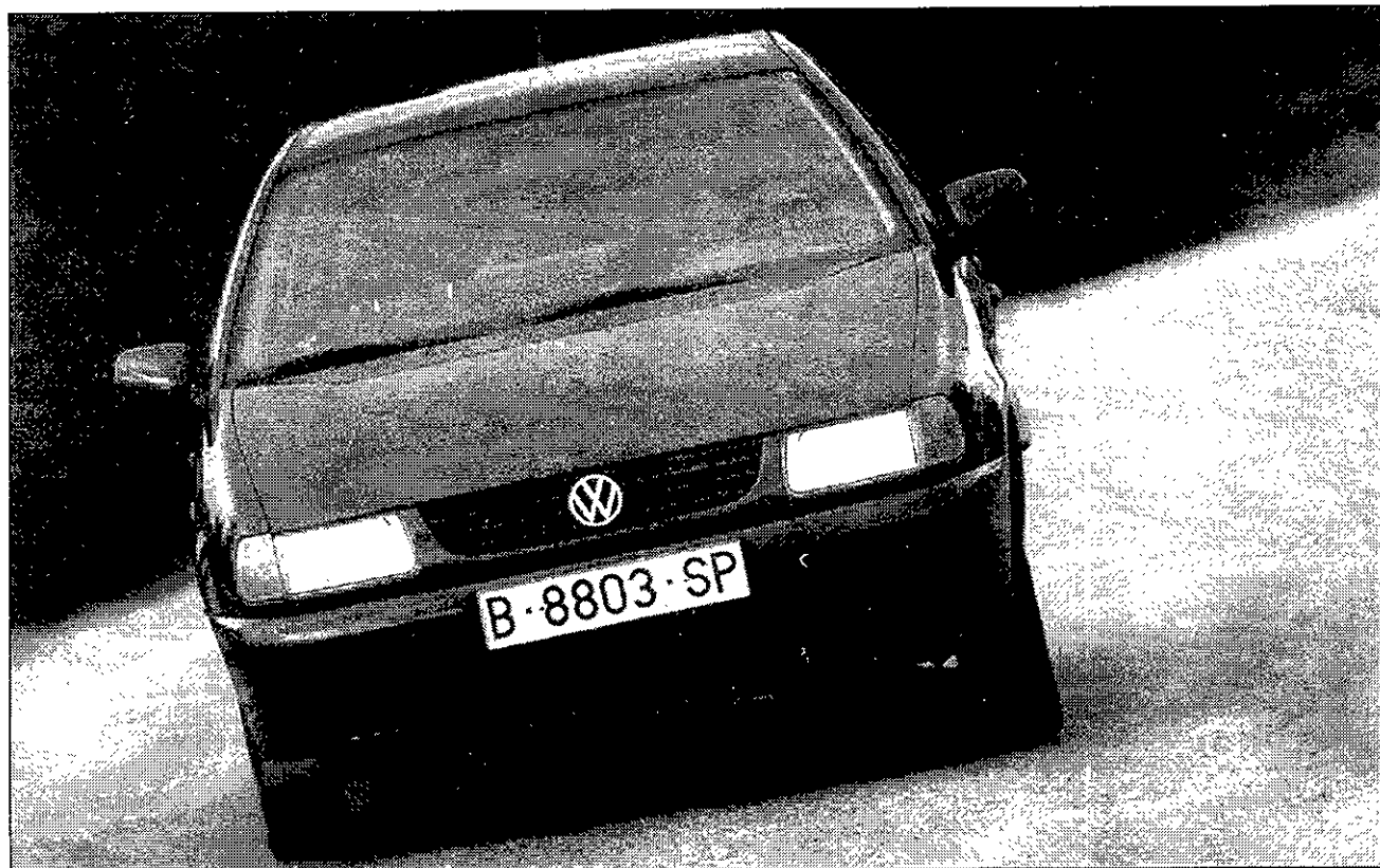
El nuevo motor de la versión básica del Polo ofrece mejores prestaciones y un menor consumo.