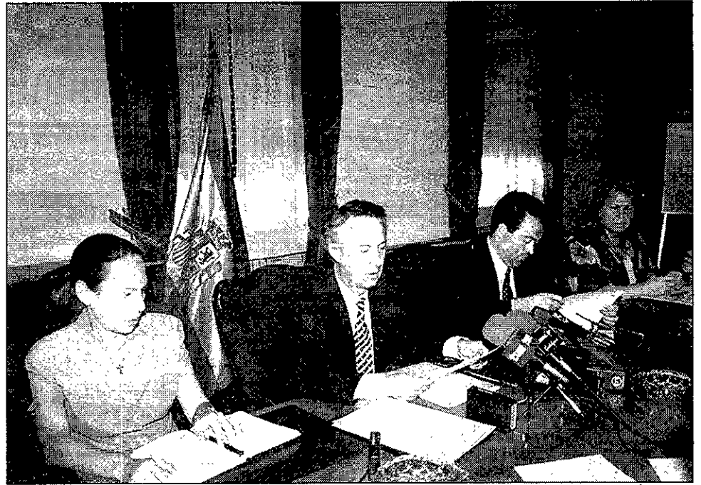
SUBDELEGACIÓN DEL G.

En El Casar, al no existir espacios que puedan ser adaptados, se hace necesaria la construcción de un nuevo