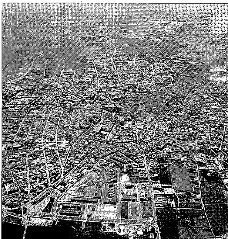
Imagen aérea del casco urbano de la localidad daimieleña.

Además, se acometen otras mejoras como la modificación en el entorno de San Pedro, acogida a convenio con la Consejería de Urbanismo. Según confirmó la concejala, «previsiblemente concluirán este mes de noviembre».