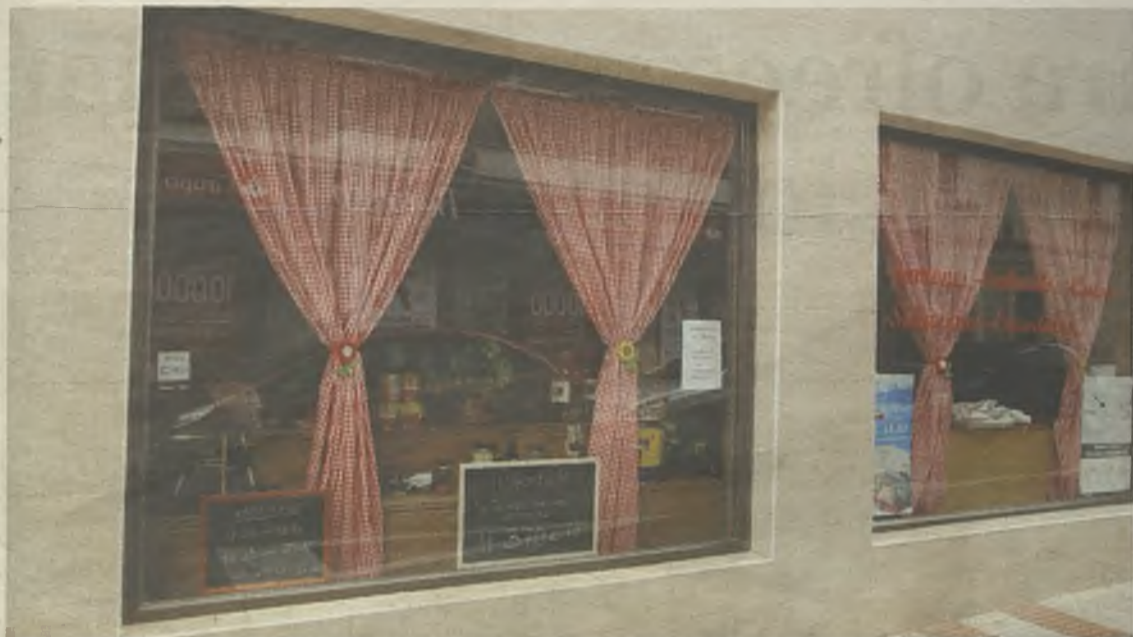
La Licencia Express permite que se reduzcan los plazos a la hora de abrir comercios

la medida de lo posible, todos los trámites.