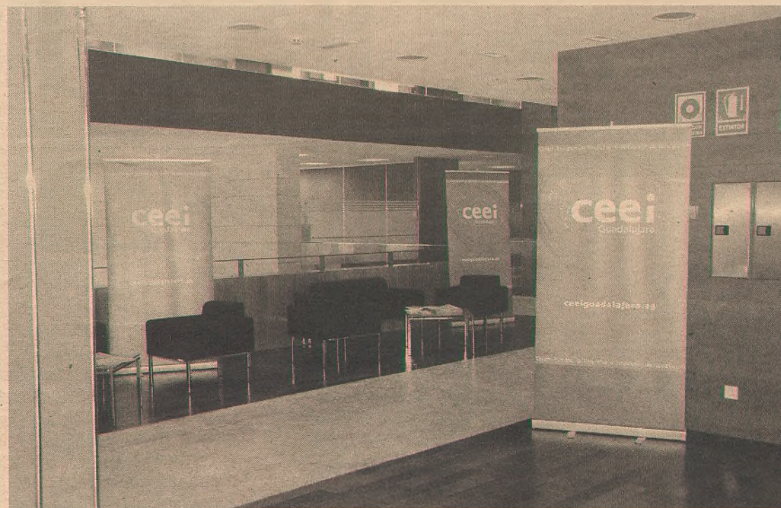
Las instalaciones ofrecen todos los servicios que los emprendedores necesitan.

La segunda parte de la jornada de redes sociales, la más práctica, entre otras cosas, tendrá como contenidos, varios casos de éxito en PYMES, así como las redes sociales y la geolocalización o las pautas básicas a seguir para la creación de una página en Facebook o un perfil en Twitter.