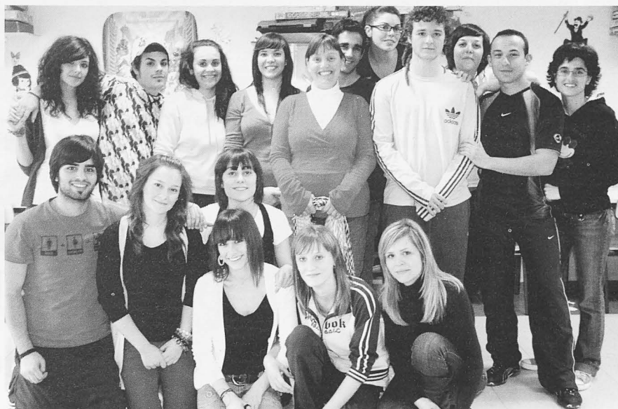
Alumnos del curso de monitor juvenil.

18 chicos y chicas durante diez horas de clase. Los jóvenes han disfrutado igualmente de nuevos multicampeonatos para juegos de tabú y trivial, en los que han participado 63 inscritos divididos en 15 equipos para tabú y 9 para trivial.