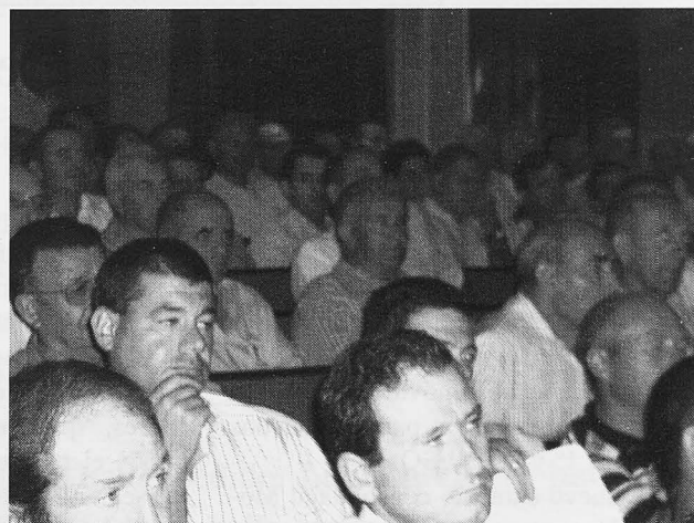
Asistentes a la asamblea de la cooperativa.

En cuanto a la calidad de los vinos de la nueva campaña, que se ha visto premiada en diferentes certámenes, señalaba Vicente Crespo que "nuestro deseo es tener vino que pueda mantener la misma línea de elaboración que hemos venido desarrollando en los últimos años". Indicaba que se ha conseguido el nivel de años anteriores, aunque quedan pendientes los trasiegos, así como las últimas analíticas y embotellado, pero señalaba que "podremos mantener la calidad sin ningún problema".