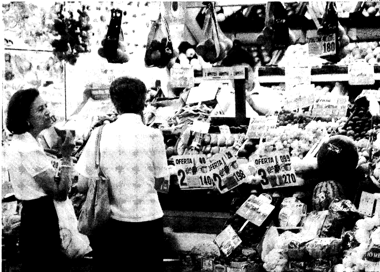
Los empresarios de Villarrobledo defienden el empleo en el pequeño comercio.

Aseguran que en el comercio tradicional los contratos son más estables