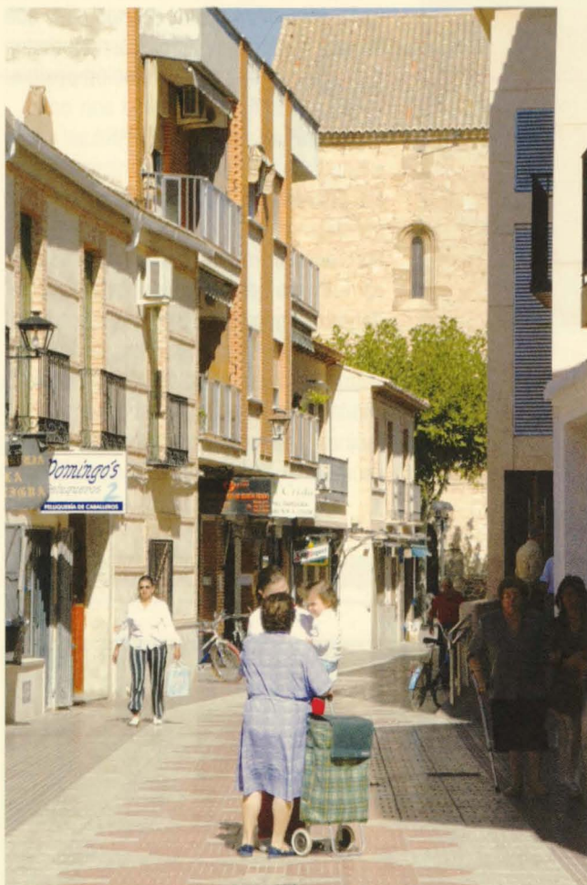
El pueblo incrementó espectacularmente su población entre 1993 y 1996.

La estructura de la población de Miguelurturra deja bien a las claras que estamos ante un pueblo joven y dinámico, cuya pirámide se ensancha en la franja comprendida entre los 30 y los 40 años, según el INE. Los nacimientos superan claramente a las defunciones y los datos de envejecimiento, maternidad y reemplazo, se sitúan llamativamente en mejores posiciones que la media