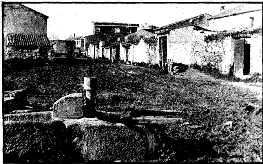
El arroyo al que vertían las aguas sucias ha sido canalizado.