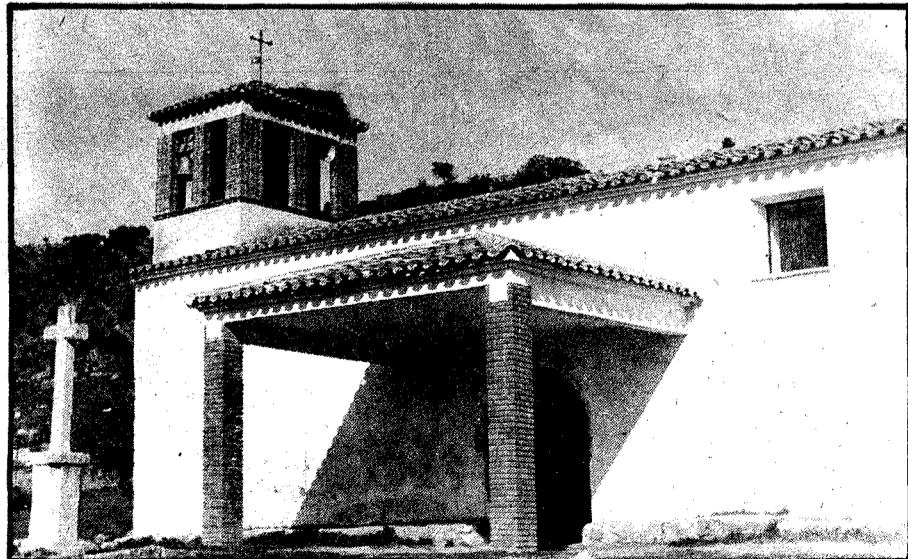
Vista parcial de la iglesia parroquial.