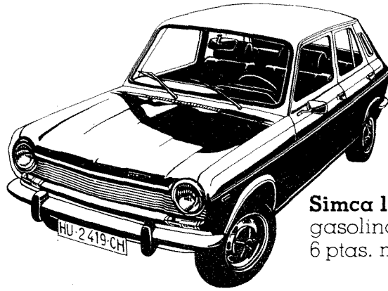
Simca 1200 LS 5 puertas: gasolina normal. 6 ptas. menos por litro.