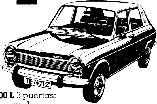
Simca 1200 L 3 puertas: gasolina normal. 6 ptas. menos por litro.