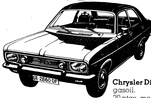
Chrysler Diesel. gasoil. 20 ptas. menos por litro.

Por cara que se ponga la gasolina, Chrysler España siempre tiene previsto el ahorro. Por eso siempre dispone de coches que no gastan gasolina, o que la gastan barata.